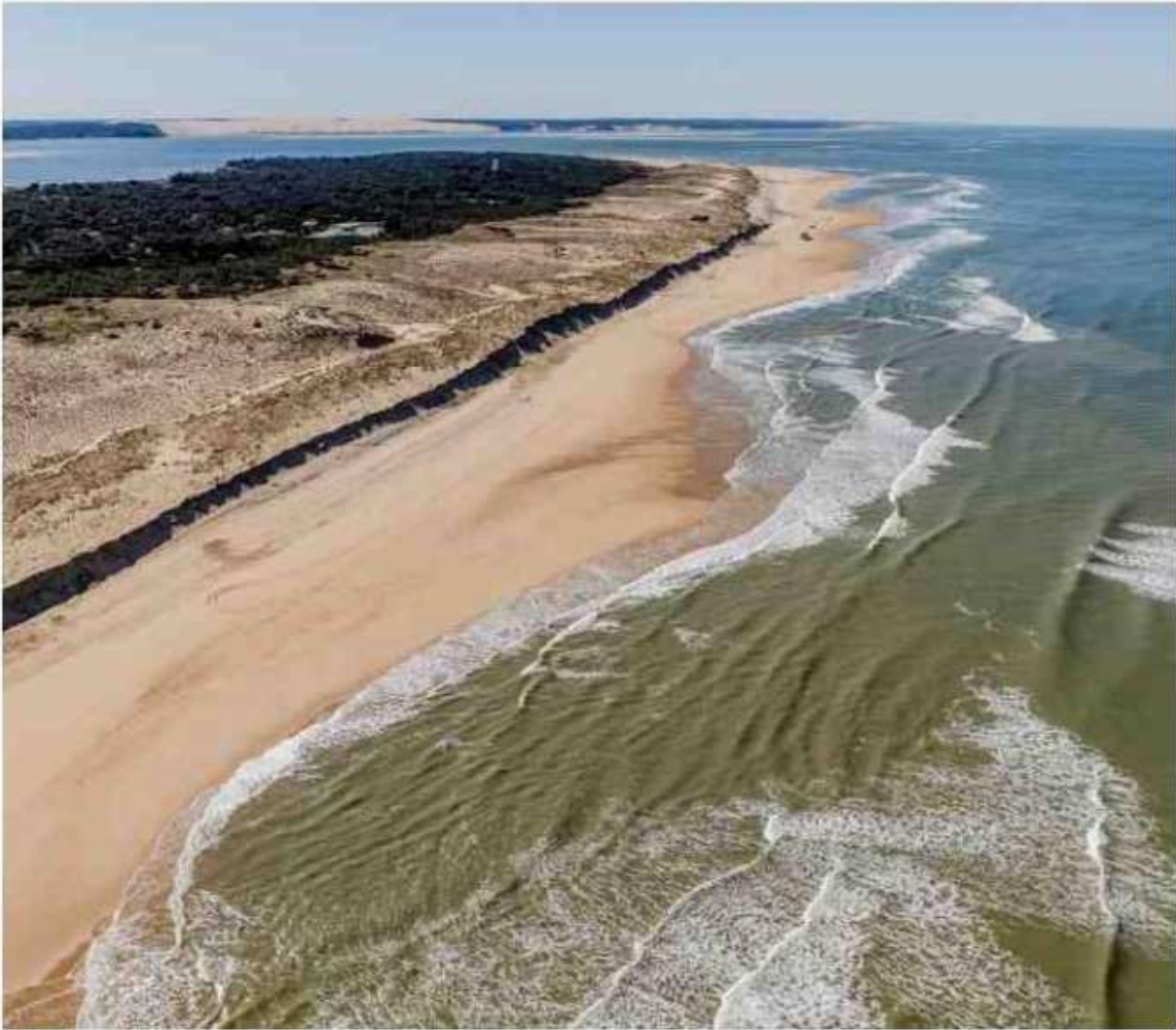
Les plages près de la pointe du Cap Ferret, où l'on distingue nettement comment la dune a été tranchée par les flots, ces dernières semaines

Publié le 27/04/2024 – Sud-Ouest – Photos de Guillaume Bonnaud