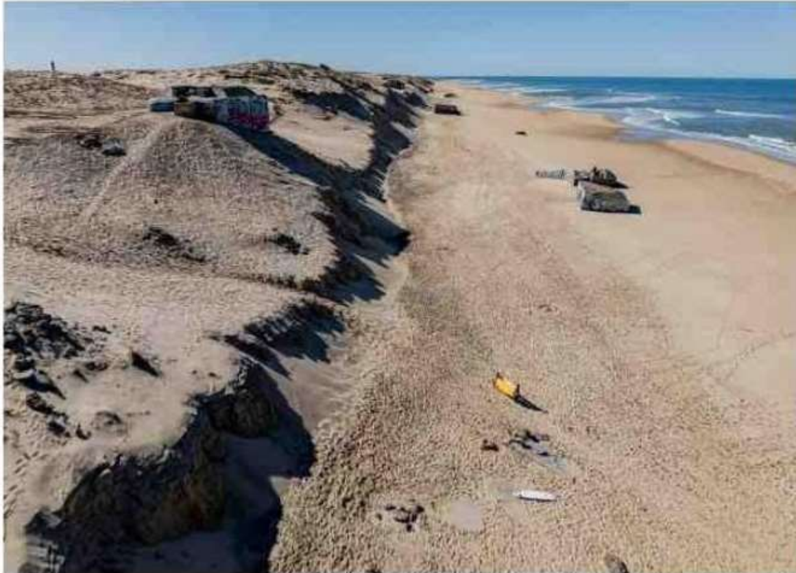
Au nord de l'Horizon, le cordon dunaire nettement marqué par les assauts de l'océan, avec une cassure importante de la dune