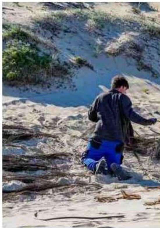
35 000 pieds d'oyats, protégés par des branches de genêts, ont été plantés pour fixer la dune, sur la plage de l'Horizon