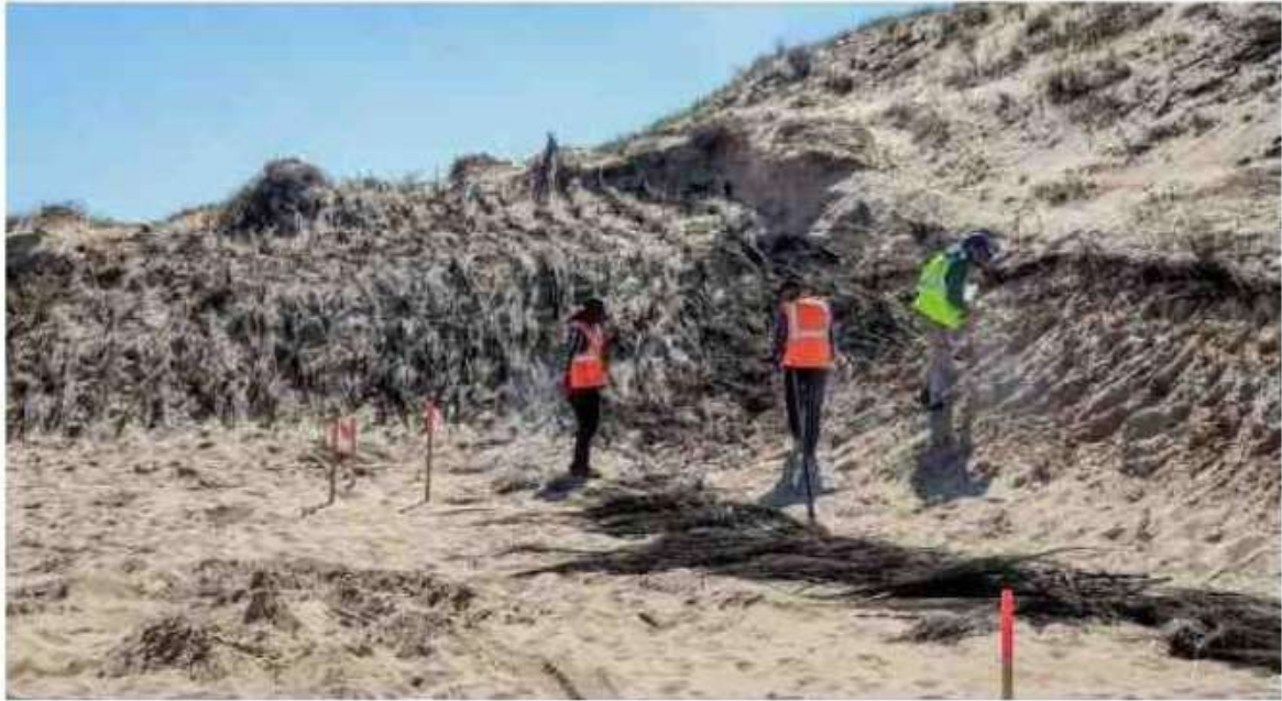
La dune est consolidée