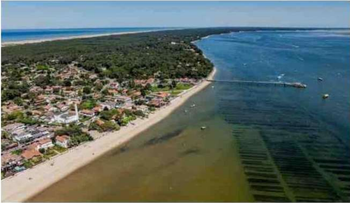
Le Mimbeau est le secteur le plus menacé par l'érosion à terme