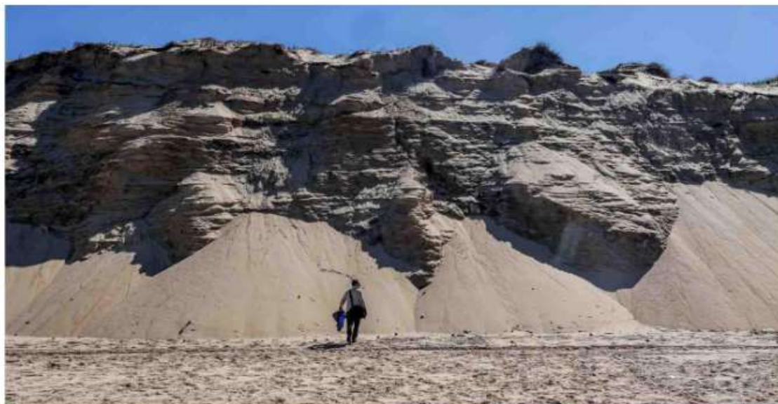
La dune a été rognée jusqu'à former des falaises presque verticales, sur plusieurs mètres de hauteur, comme ici au nord de la plage de l'Horizon