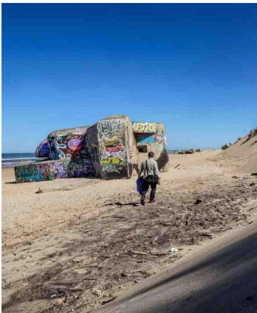
Des blockhaus sont déjà tombés sur la plage, d'autres menacent de faire de même