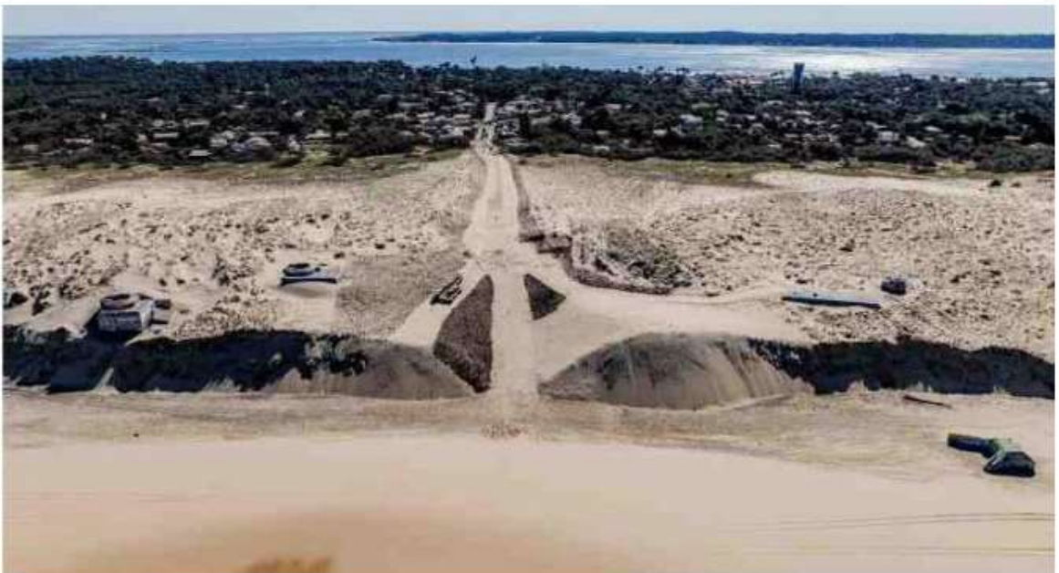
La plage de l'Horizon a été entièrement reprofilée au bulldozer pour aménager un accès praticable pour les baigneurs